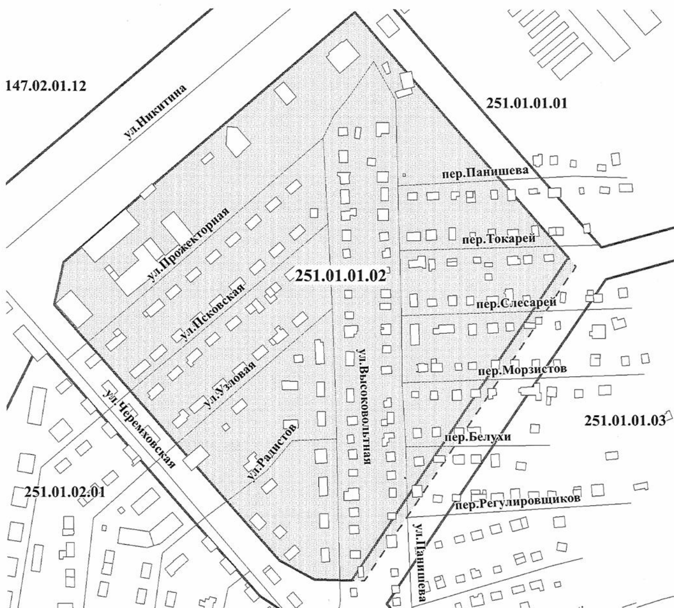
СХЕМА границ территории квартала 251.01.01.02 в границах планировки территории, ограниченной ул. Автогенной, ул. Никитина, ул. Доватора, ул. Панфиловцев, в Октябрьском районе

Приложение 1 к постановлению мэрии города Новосибирска от 09.12.2024 № 10714